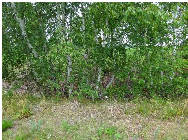
Abbildung 8: Gehölzbestand entlang der nord-östlichen Begrenzung des Geltungsbereiches, Versickerungsmulde im Hintergrund

Unweit des Kreisverkehrs hat sich ein kleinflächiger, spontan aufgewachsener Gehölzbestand etabliert. Bestandsbildende Gehölzarten sind Stiel-Eiche ( Quercus robur ), Hänge-Birke ( Betula pendula ) und Steinweichsel ( Prunus mahaleb ).