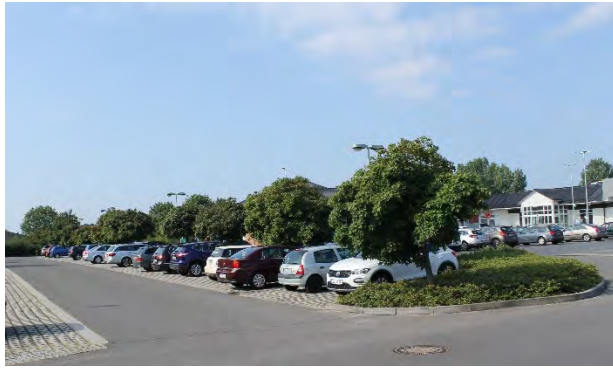
Abbildung 4: begrünter Streifen zwischen den Parkplätzen

Entlang der Ostseite des ehemaligen Geltungsbereiches ist die Pflanzung einer weiteren mehrreihigen Hecke im Vorhaben- und Erschließungsplan H1 festgesetzt. Diese wurde entsprechend gepflanzt. Auf dem Foto in der Abbildung 5 ist die Hecke erkennbar. Es handelt sich um eine Hecke mit dem Feld-Ahorn ( Acer campestre ) als Überhälter und vorwiegend nicht heimischen Ziergehölzarten wie dem Flieder ( Syringa vulgaris ), der Büschel-Rose ( Rosa multiflora ), der Forsythie ( Forsythia × intermedia ), dem Buchsbaum ( Buxus sempervirens ) und der Apfelrose ( Rosa rugosa ) in der Strauchschicht.