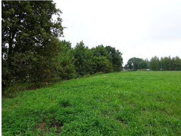
Abbildung 7: Gehölzbestand entlang der nord-westlichen Begrenzung des Geltungsbereiches sowie Frischwiese, verarmte Ausprägung im Vordergrund

Die nordöstliche Flanke des Geltungsbereiches wird ebenfalls von einem Baumbestand begleitet, mit dem Berg-Ahorn als Bestandsbildner. Einzelne Eichen höheren Alters treten hinzu. Der Gehölzbestand schließt eine Niederschlagswasserversickerungsmulde ein. Diese dient der verzögerten Versickerung von Niederschlagswasser der angrenzenden Straße. Die Mulde wird von einem Jungaufwuchs von Birken ( Betula pendula ) und Stiel-Eichen ( Quercus robur ) begleitet, vgl. Abbildung 8.