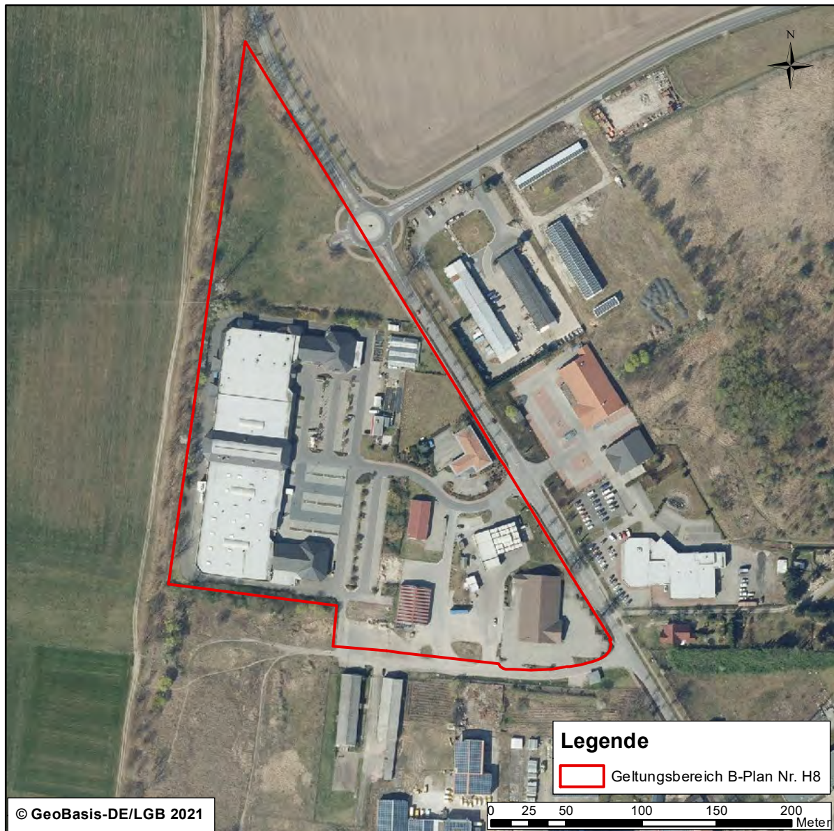
Abbildung 1: Luftbildausschnitt mit Kennzeichnung des Bebauungsplangebietes Nr. H8 „EKZ Fürstenwalder Straße“

Das Plangebiet überschneidet sich nicht mit einem nationalen bzw. europäischen Schutzgebiet. Es ist in Abbildung 1 gekennzeichnet.