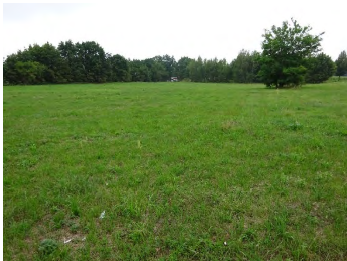
Abbildung 6: Frischwiese, verarmte Ausprägung im Norden des Geltungsbereiches 30.07.2019

Im Norden schließt der Bebauungsplan eine Fläche ein, die gegenwärtig als Grünland frischer Standorte anzusprechen ist. Augenscheinlich wird das Grünland durch Mahd bewirtschaftet bzw. gepflegt. Die Fläche wird dem Biotoptyp Frischwiese verarmte Ausprägung (051122) zugeordnet, vgl. Foto in Abbildung 6.