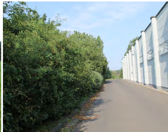
Abbildung 2: Hecke nördlich des Einkaufszentrums, im Hintergrund Hochspannungsmast