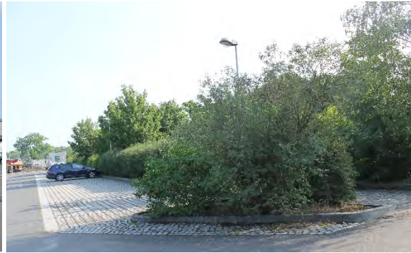
Abbildung 5: Hecke entlang der der ehemaligen Begrenzung des Geltungsbereiches des Vorhaben- und Erschließungsplanes H1